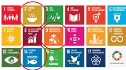
UN Sustainability Goals

Nye løsninger som oppfyller UN's bærekraftskrav: