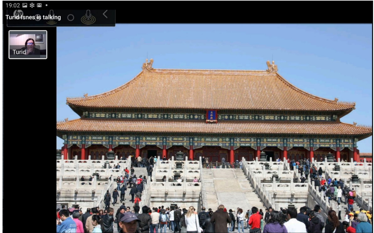
Den forbudte by